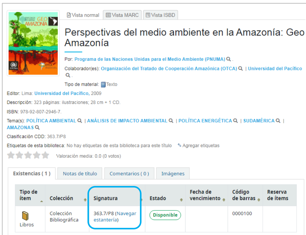
Figura 5: Opción de búsqueda “Navegar estantería”

El catálogo te permite navegar estanterías, para ello debes ingresar a un registro bibliográfico, y dirigirte a “Navegar estantería”, en seguida se mostrarán diferentes libros relacionados con tu tema de investigación.