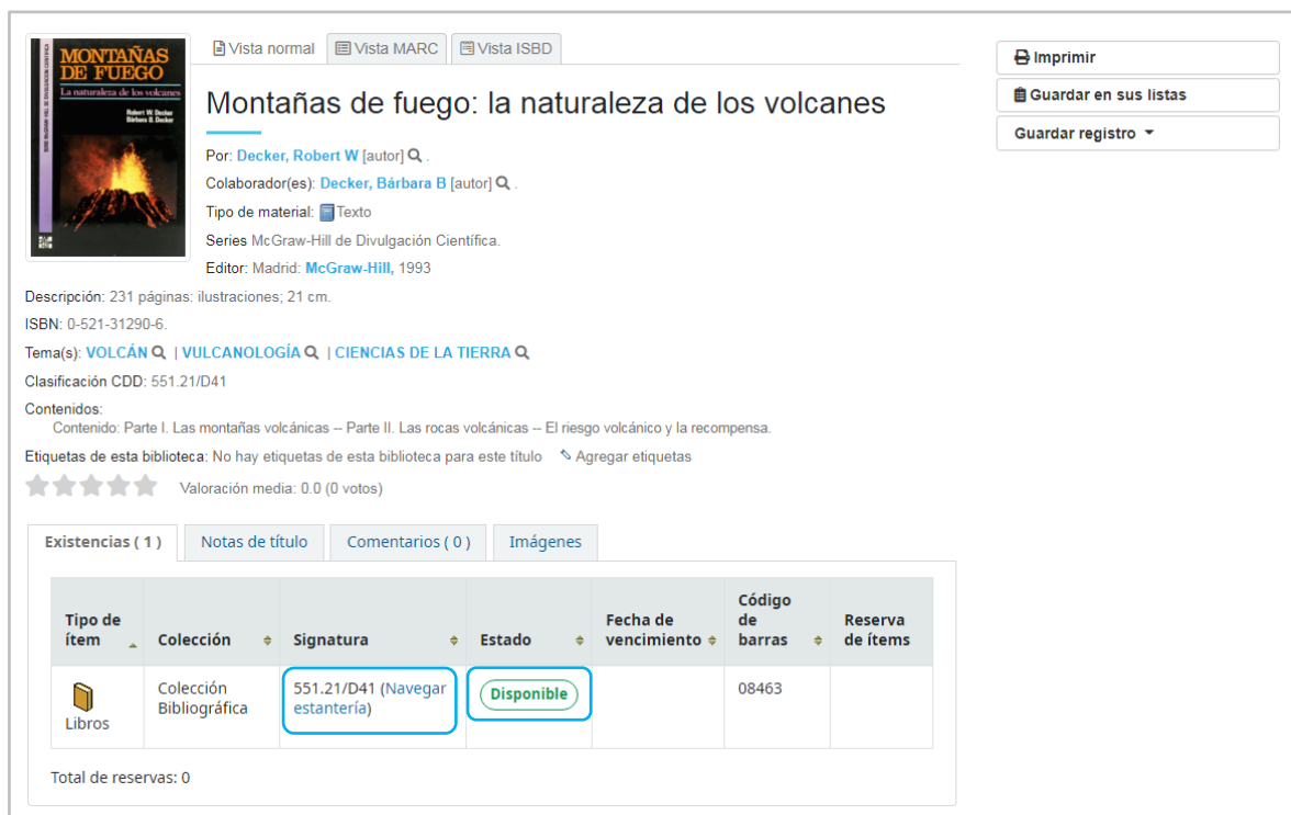
Figura 7: Registro bibliográfico del catálogo de la Biblioteca IGP

Si el libro que encontraste en el catálogo es de tu interés, debes copiar la signatura (código de clasificación) y solicitarlo en biblioteca. Es importante, que te fijes en el estado del ítem, esto te permitirá ver si el libro se encuentra disponible o en préstamo.