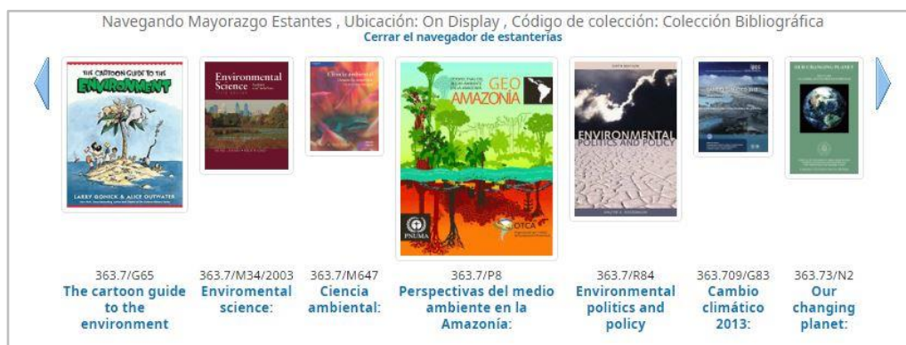
Figura 6: Navegador de estanterías