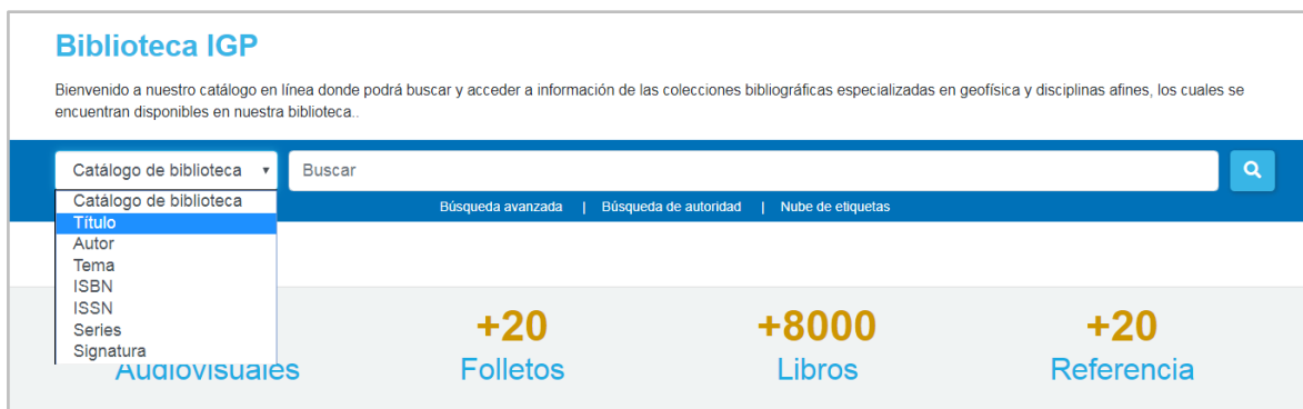
Figura 2: Opciones de búsqueda